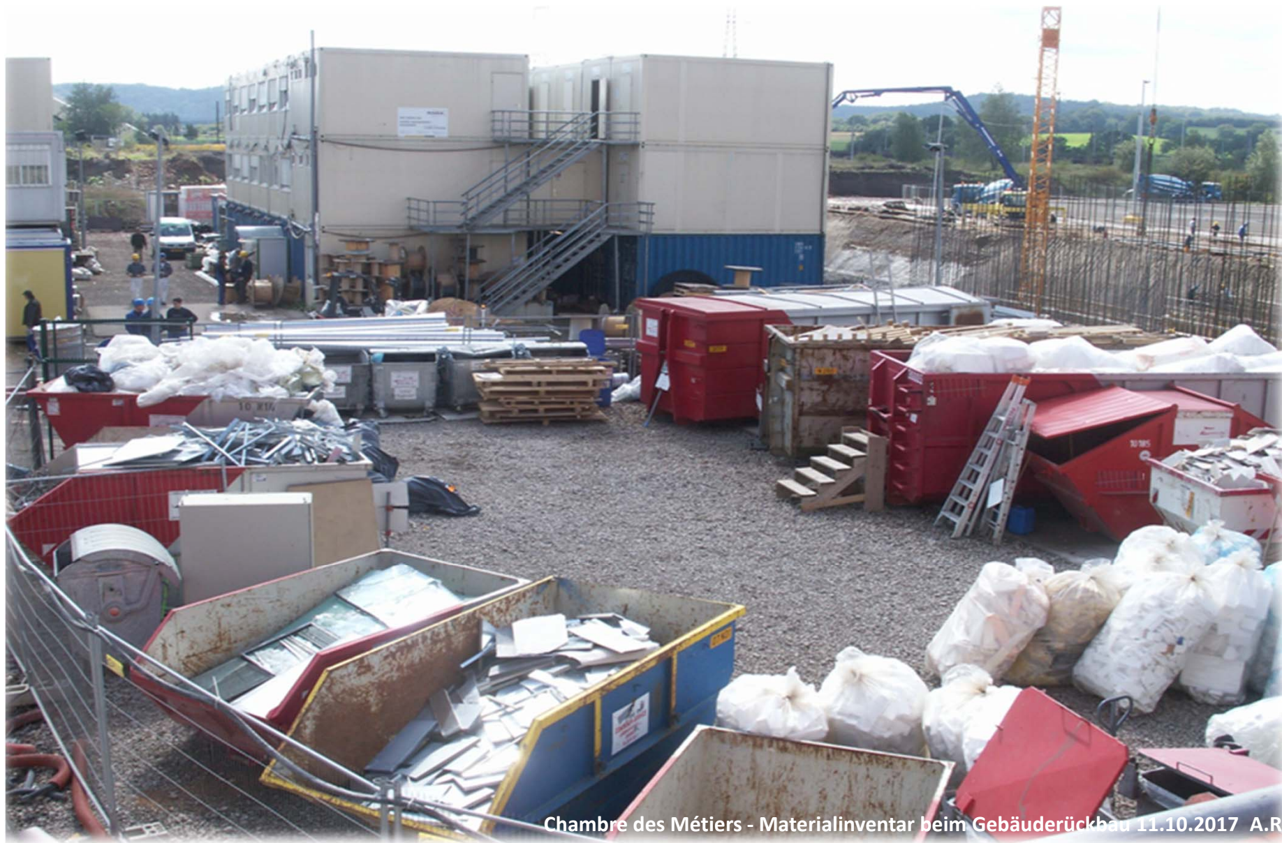
Chambre des Métiers - Materialinventar beim Gebäuderückbau 11.10.2017